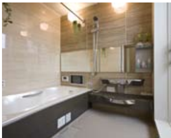
2階にあるバスルーム。専用のバルコニーは目隠しつき。扉を開けて露天風呂気分が味わえる