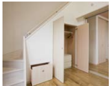
デッドスペースはすべて収納スペースに。子供部屋の階段下にはオモチャ箱も造作