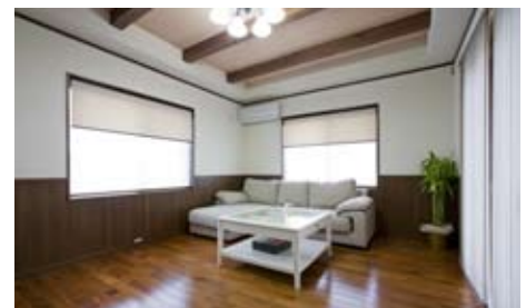
チークのフローリングと口に入れても害のない自然塗料を塗った梁でアンティーク風に仕上げたリビング