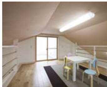
ふたつの子供部屋を結ぶロフト。屋上への通路も兼ねることで「物置化」を防いでいる