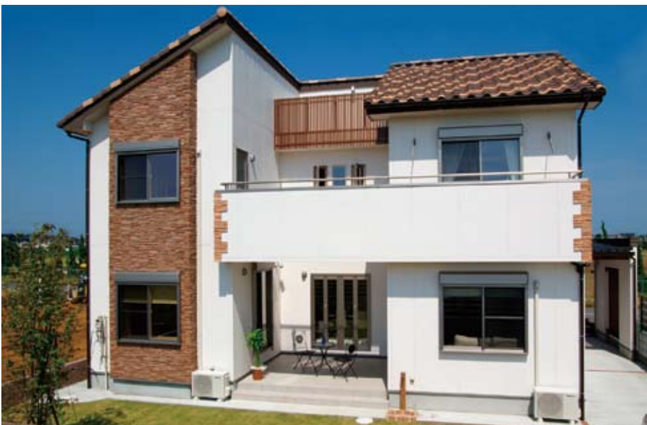
神栖のモデルハウスは南向きにコの字型で配置し、どの部屋にも光が入るような設計だ。白と茶褐色のコントラストでナチュラルな雰囲気。中央にはインナーテラスがあるが、日射しを遮るために、バルコニー部分に出し入れ可能なルーフを設けている