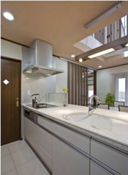
2階まで見渡せるキッチン。左手のドアは玄関へ、格子状の扉はリビングへと続く回遊性のある設計で家事効率もアップ