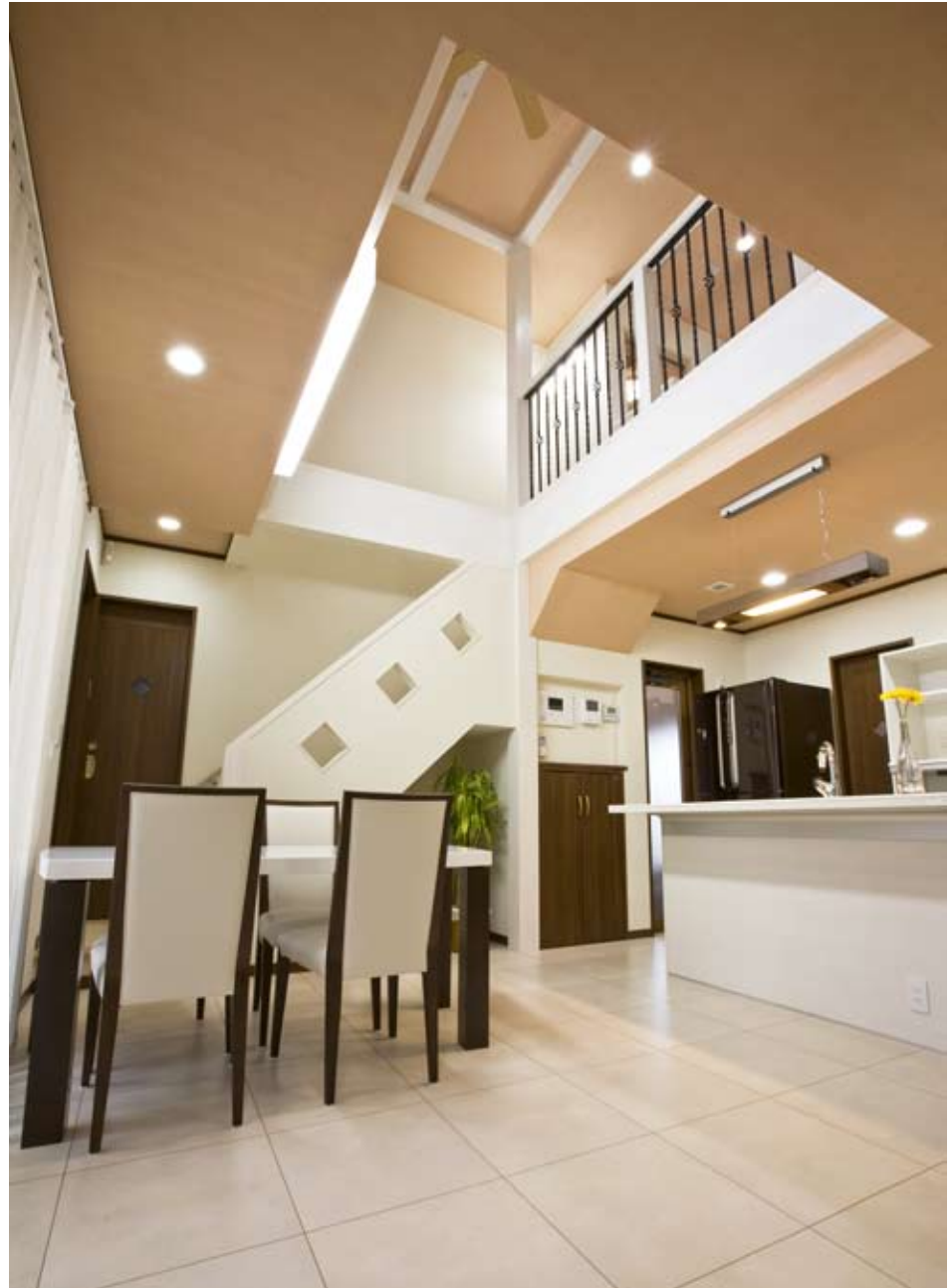
自然の光と風を取り込むプランニング。家の中央に大きな吹きぬけを設けて、室内の空気が対流するようにしている。2階は、吹きぬけの周りが回廊になっていて、どこにいても家族の気配が伝わる。強い耐震構造と断熱性能によりこの大空間が実現した