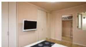
収納スペースの中にも、防虫・消臭効果に優れた抗酸化溶液を混ぜた塗材を使用

「スーパーSasa工法」に採用している抗酸化工法とは、活性酸素を抑制する働きがあるという。モデルハウスの壁には、この抗酸化効果のある液体を混ぜた珪藻土を使用。シックハウスの原因となる化学物質を分解除去、悪臭の分解や虫も寄せ付けられない効果があるという。室内を清浄な空気に保ち、住む人の健康を追求している。