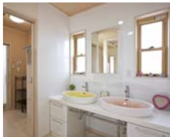
脱衣所の横にある洗面室はゆとりのスペース。家族の生活動線を考えてポウルも2つ設置